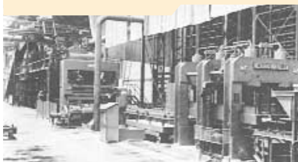
Θερμή μονή πρέσα τύπου Becker & van Hullen (1945)